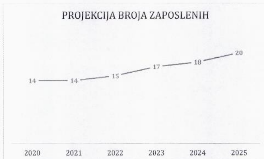
Grafički prikaz: Plan kretanja broja zaposlenih po godinama

Planirano kretanje broja zaposlenih prikazano je grafičkim prikazom u nastavku, a odnosi se na period od 2020. g. - 2025. g. Grafički prikaz prikazuje povećanje broja zaposlenih u odnosu na prethodne godine (prosječan broj zaposlenih) što je rezultat restrukturiranja tvrtke i povećanja prodaje do kojeg je došlo kroz projekciju budućeg poslovanja tvrtke.